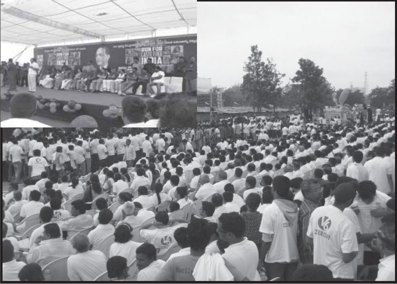
అంబేద్కర్ జయంతి సందర్భంగా శాంతి చక్ర ఇంటర్నేషనల్ వారు నెక్లెస్ రోడ్ లో నిర్వహించిన “క్యాస్ట్ ఫ్రీ ఇండియా రన్”