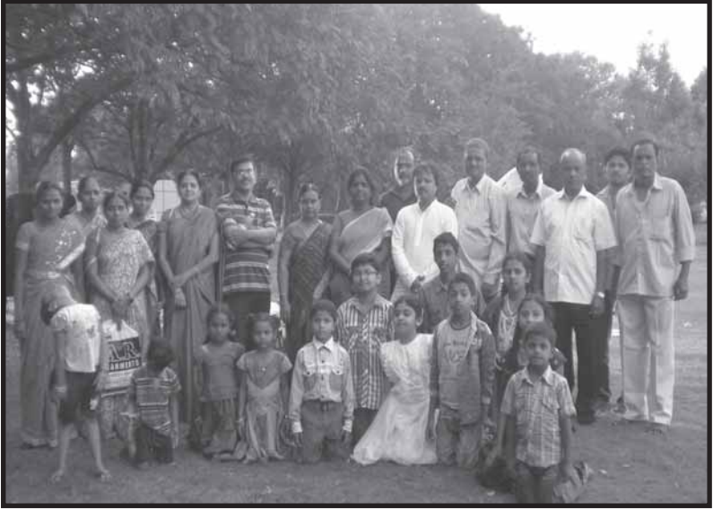
కుల రహిత సమసమాజ నిర్మాణ ఏర్పాట్లలో మా మొదటి కార్తీక మాస వనభోజన కార్యక్రమం